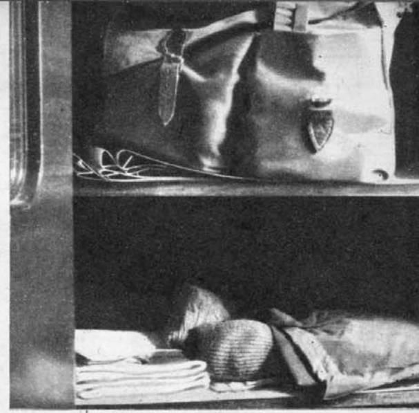
Der einzige Besitz des Wunderdoktors, der von Stadt zu Stadt zieht, um endlich als Ostvertriebener einen stillen Ort zu finden, in dem er ungestört kranken Menschen helfen kann: ein wenig Wäsche, eine Segeltuchtasche, eine Bürste — das ist alles

Haus und Garten wurden gestürmt, eine Holzlaube ging zu Bruch, die Gartenmöbel (Bild links) sahen hinterher übel aus. Auch eine solide Mauer war dem Ansturm der Kranken nicht gewachsen (Bild rechts)