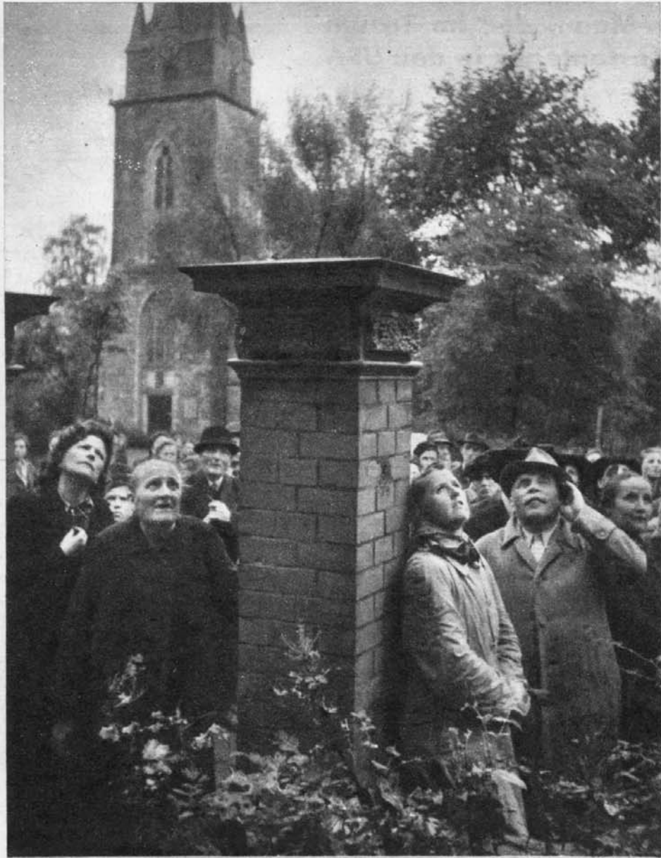
Sehnsüchtig und hoffnungsvoll schauen Kranke, Heilungsuchende zum Balkon des Hauses. Bruno Gröning spricht zu ihnen, beruhigt sie: „Euch wird allen geholfen!“ Der Ausdruck der Gläubigkeit, der sich auf den Gesichtern spiegelt, ist erschütternd

Ein Sonderbericht für die Nord-West-Illustrierte von Helmut Pirath