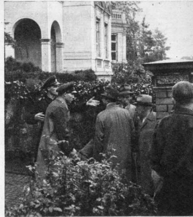
Polizei mußte eingreifen, so stark war der Ansturm auf das provisorische Quartier Grönings in Hamburg. Die Kranken ließen sich nicht abhalten