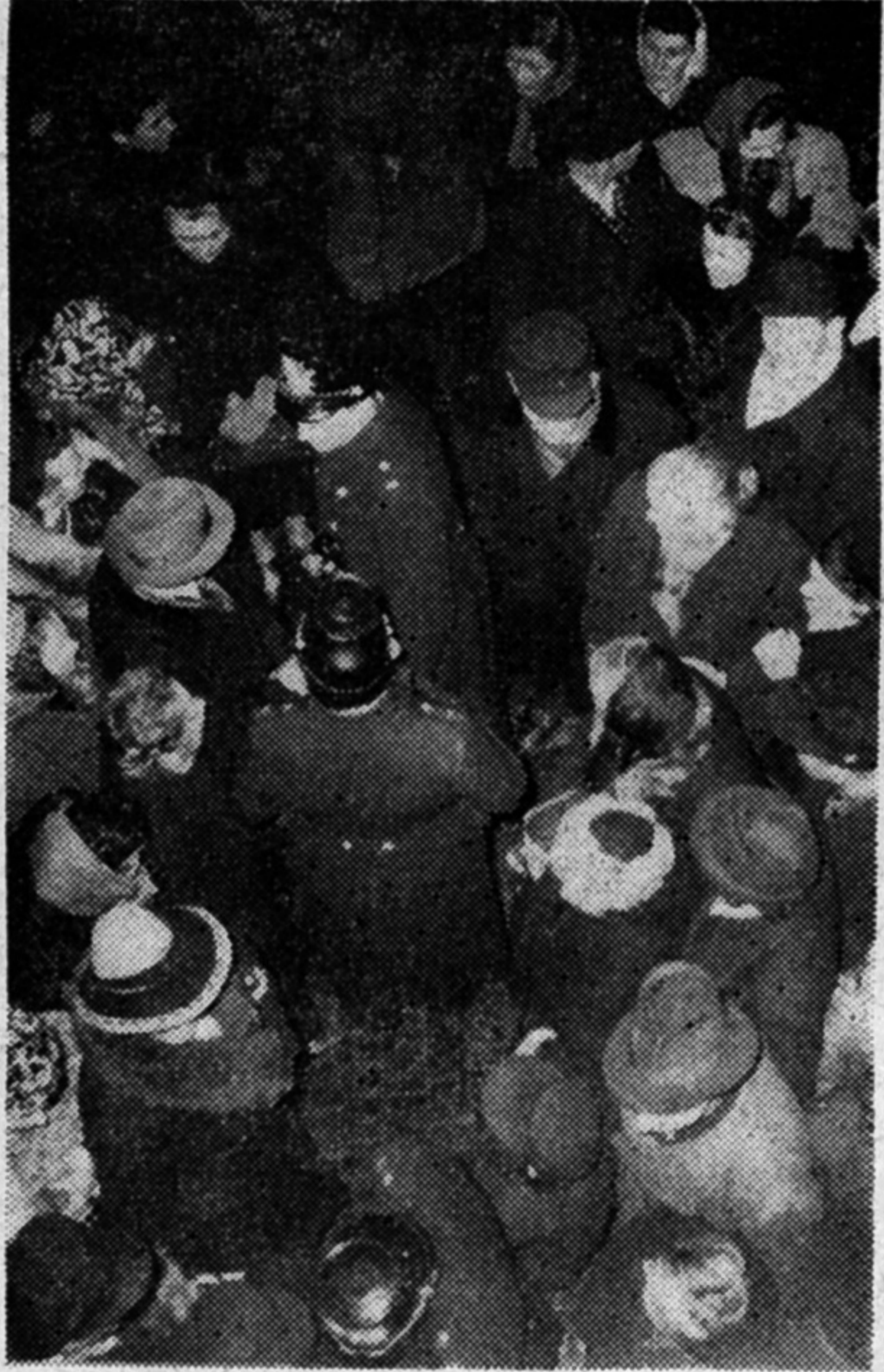
Neun Stunden stehen die Kranken wartend vor dem Hause.

(CWC) Oldenburg. Dem Vorwurf des Kreises um Bruno Gröning, die Presse bemühe sich nicht, objektiv über ihn zu berichten zu begegnen, geben wir an dieser Stelle einen chronologischen Bericht über die Ereignisse der Nacht vom 3. zum 4. Februar im „Astoria“ zu Oldenburg. In dieser Nacht bemühten sich Gröning und seine Helfer um 67 teils schwer, teils weniger schwer Erkrankte und rollte die Heil- und Behandlungsmethode Grönings auch vor