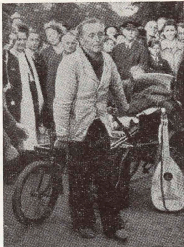
. . . erhebt sich angesichts der ergriffenen »Zuschauer« das erstmal ganz allein aus dem Stuhl!