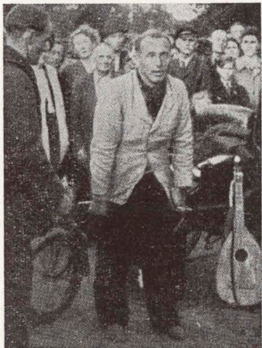
Er geht, noch zaghaft und unsicher, die ersten zehn Schritte! Aber er geht!