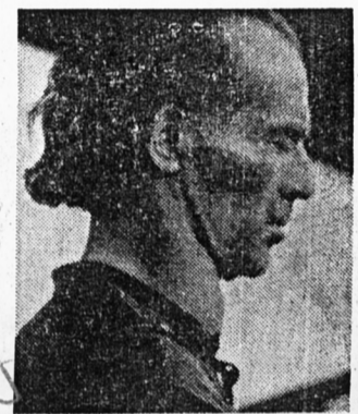
Diese Aufnahme von Bruno Gröning wurde 1949 gemacht, als er von einem Fenster des „Traberhofes“ aus zu der blutenden, hoffenden und harrenden Menschenmasse sprach, die Heilung von ihm erliefte.

In großen Personenwagen mit angehängten Wohnwagen trafen Zigeuner oder solche, Bruno Gröning 1949 auf dem Traberhof