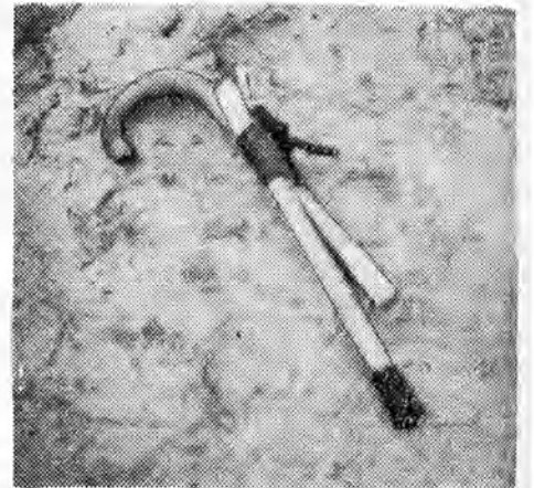
Krücken außer Dienst

Ein freundlicher Händedruck beendet das Gespräch mit einem Menschen, der, den Partner